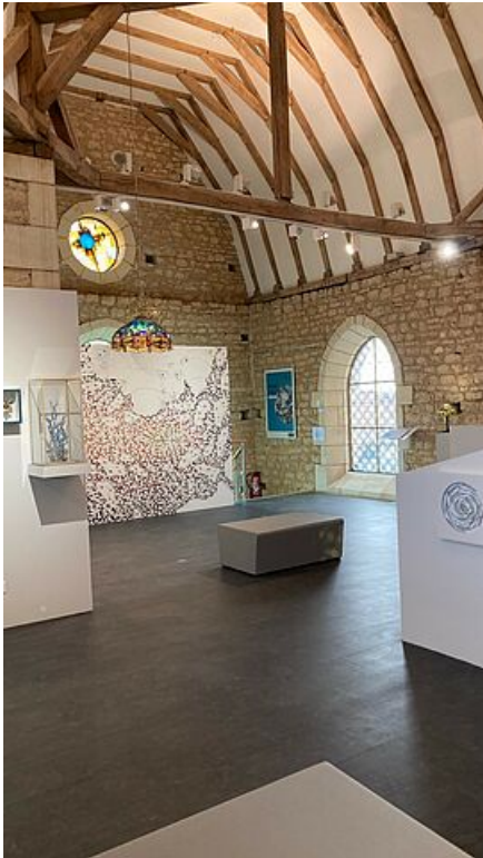
Exposition Tiffany d'Aujourd'hui

Pour la saison 2027, le Musée du Vitrail de Grand Poitiers prépare sa nouvelle exposition temporaire qui aura lieu du 3 avril au 7 novembre 2027.