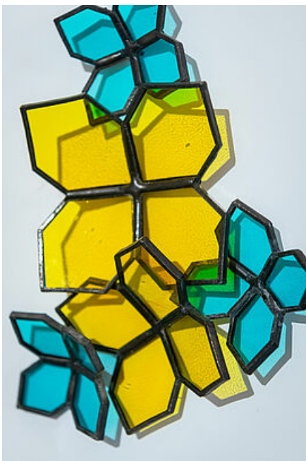
Détail Vitreries Fleuries Aline Thibault