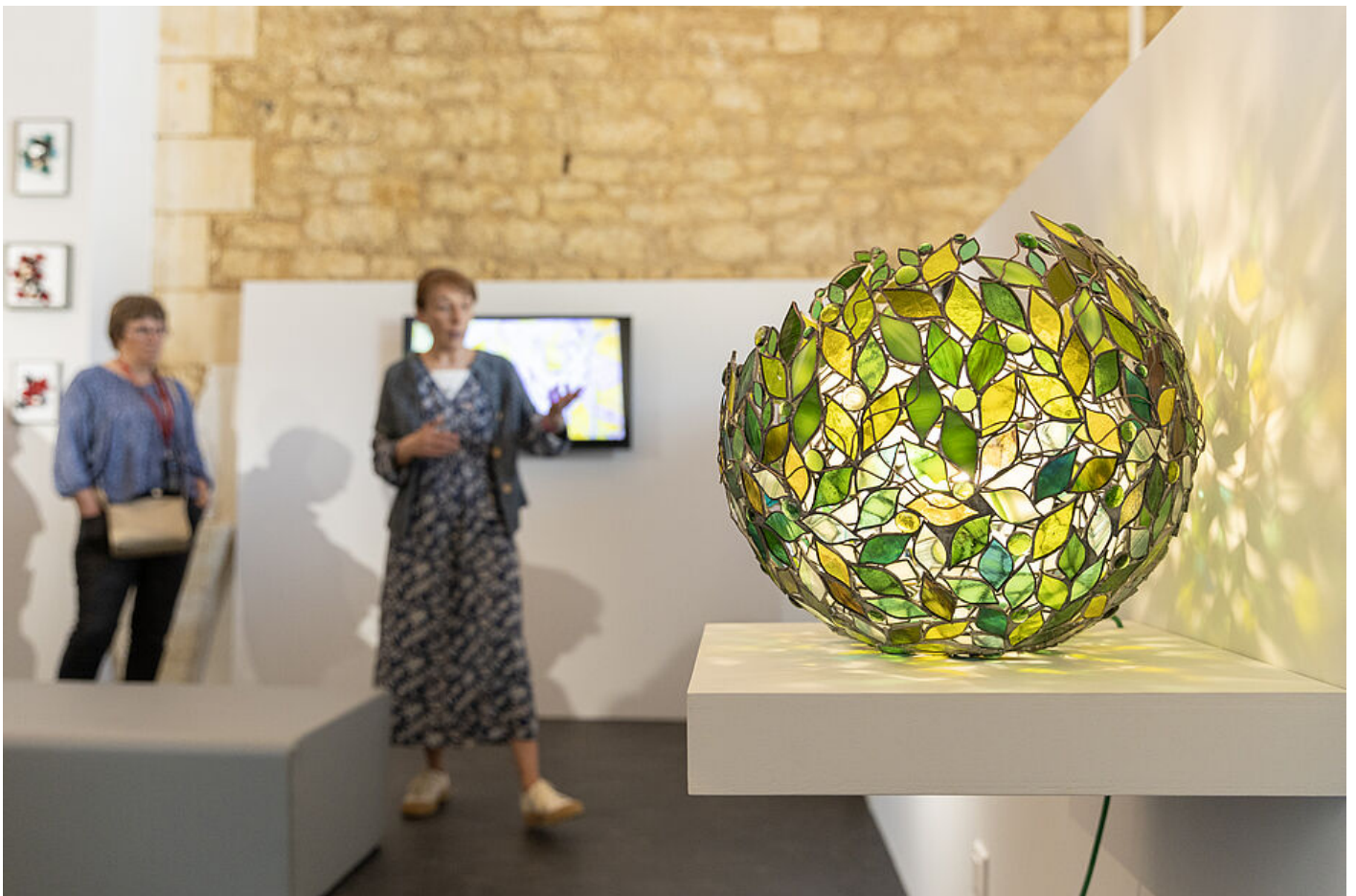
Inauguration 2025

Visites commentées chaque jour ouvrable à 15h30, à partir de 4 visiteurs